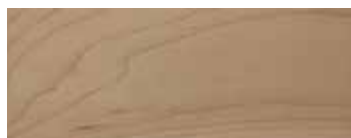
ACERO · MAPLE · AHORN · ERABLE · ARCE