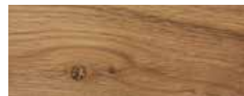
ROVERE CON NODI · OAK WITH KNOTS · EICHE MIT KNOTEN · CHÊNE AVEC NŒUDS · ROBLE CON NUDOS