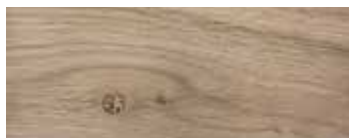
* ROVERE CON NODI PIGMENTATO BIANCO LATTE · WHITE MILK PIGMENTED OAK WITH KNOTS · EICHE MIT KNOTEN MILCHWEISS PIGMENTIERT · CHÊNE AVEC NŒUDS PIGMENTÉ BLANC LAITEUX · ROBLE CON NUDOS PIGMENTADO BLANCO LECHE