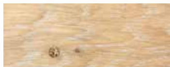
ROVERE CON NODI SBIANCATO CERA · WHITENED OAK WITH KNOTS WAX · EICHE MIT KNOTEN GEWEISST UND GEWACHST · CHÊNE AVEC NŒUDS BLANCHI CIRE · ROBLE CON NUDOS BLANQUEADO Y ACABADO CERA