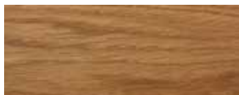
ROVERE · OAK · EICHE · CHÊNE · ROBLE