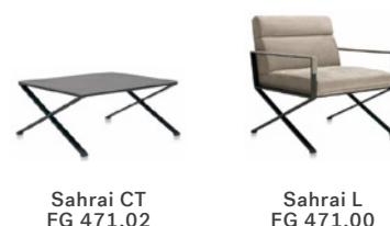
Sahrai CT FG 471.02