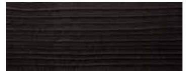
CEDRO VULCANO · VULCANO CEDAR · ZEDER VULCANO · CÈDRE VULCANO CEDRO VULCANO