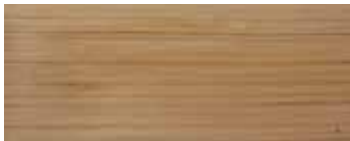
CEDRO · CEDAR · ZEDER · CÈDRE · CEDRO