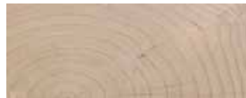
CEDRO CONTRACT · CEDAR CONTRACT FINISHING · ZEDER CONTRACT AUSFÜHRUNG CÈDRE FINITION CONTRACT · CEDRO ACABADO CONTRACT