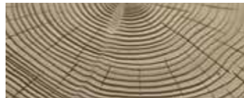
CEDRO SABBIAITO · SANDBLASTED CEDAR · ZEDER SANDGESTRAHLT · CÈDRE SABLE CEDRO ARENADO